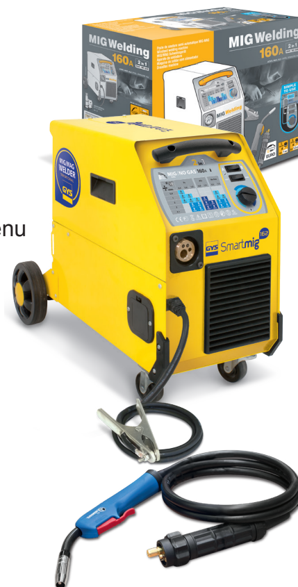
Dodávána se zemnicím kabelem a 2,2 m EURO hořákem.

Konstantní chod ventilátoru chrání přístroj před přehřátím.